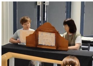
リーディングユニット 劇団ふたり