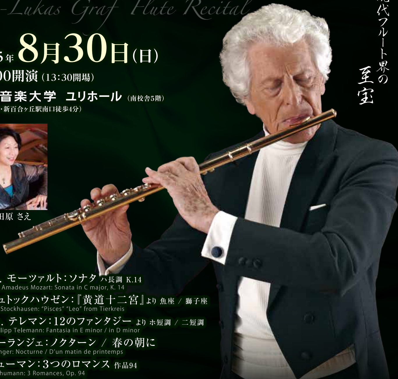
フルート ペーター・ルーカス・グラーフ